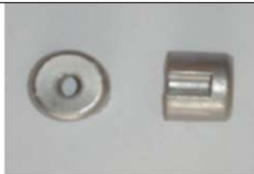
Tassello M10 h=26 d=30 mm per tubo Al d=35 Cod. 31299