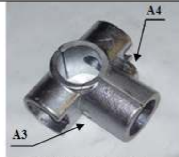
GIUNTO "A" a 5 vie