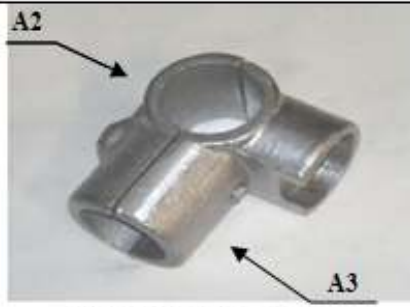
GIUNTO "A" a 4 vie