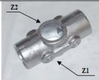
GIUNTO "Z" a 4 vie

Z1-Z2 Cod. 31272 Con n. 2 viti TB M10x45