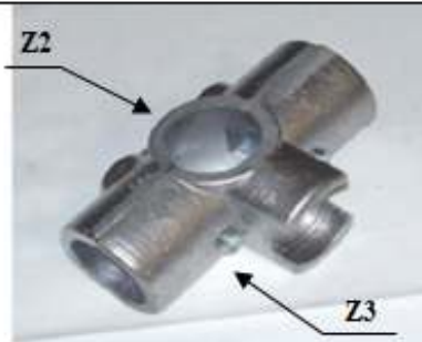
GIUNTO "Z" a 5 vie

Z1-Z2 Cod. 31272 Con n. 2 viti TB M10x45