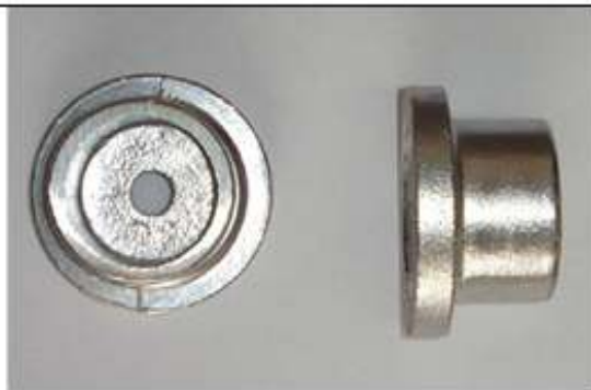
Base per tubo alluminio d=35 Cod. 31154

Z3-Z4 Cod. 31132 Con n. 2 viti TB M10x45